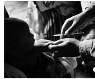
Vacunando a un niño en la escuela de la aldea, Etiopía. Autor: Pablo María García Llamas. Fuente: banco de imágenes, Mepsyd.

Autor: Pablo María García Llamas. Fuente: banco de imágenes, Mepsyd.