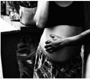
Mujer embarazada, favela Horizonte Azul, Sao Paulo, Brasil.