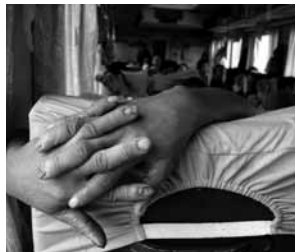
La caricia del tiempo. Reunificación Express, Vietnam. Autor: Alfredo García Gil.