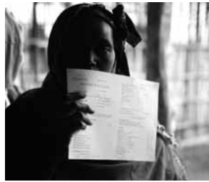
Mujer con tarjeta sanitaria esperando a ser atendida, Etiopía.