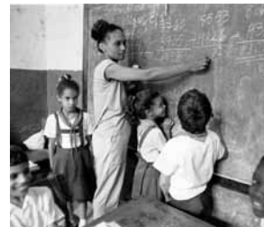
Educación en Cuba. Autor: Javier Rodríguez Gómez.