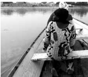
Bailando el agua. Saint Louis, Senegal.