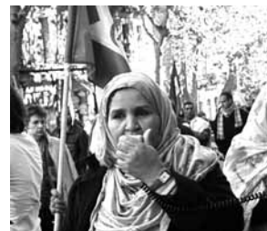
Lideresas. Autora: Ainhoa Zamora Peralta.