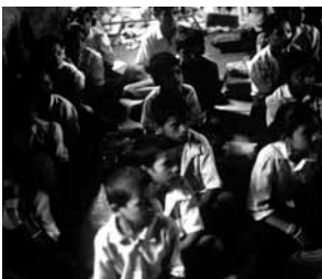
Ilusión en las aulas. Rui Petha, Estado de Maharashtra, India. Autor: Alfredo García Gil.