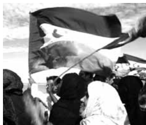
Mujeres con la reivindicación como bandera. Autora: Ainhoa Zamora Peralta.