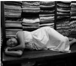
Descanso entre las telas. Mercado de Textiles, Hoi An, Vietnam. Autor: Alfredo García Gil.