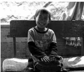
Alegría a bordo. Río Mekong, Laos. Autor: Alfredo García Gil.