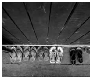
Pies que aprenden. Inlay Lake, Myanmar.