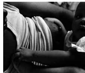
Mujer amamantando, favela Horizonte Azul, Sao Paulo, Brasil.