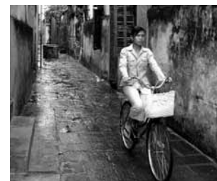
Independencia en las calles. Hoi An, Vietnam. Autor: Alfredo García Gil.