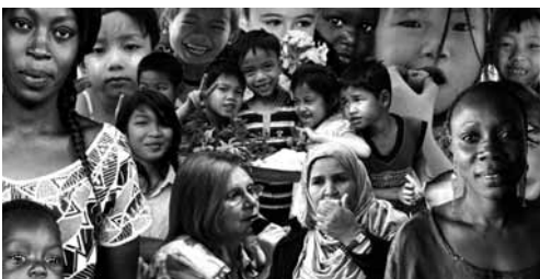
Todas y todos juntos. Collage compuesto con fotografías de varios autores.