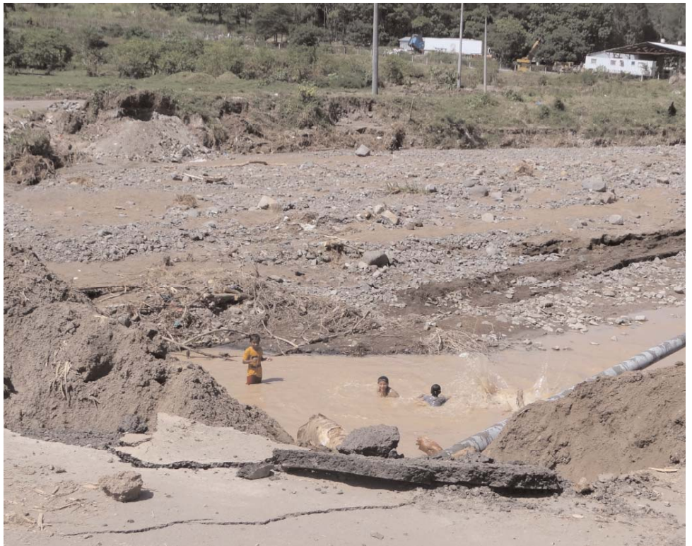
Infraestructuras destruidas o cosechas arruinadas son algunos de los efectos patentes de las pasadas inundaciones

En coordinación con ISCOD en España y la representación sindical, se procedió a solicitar ayuda del fondo de solidaridad creado con las retenciones efectuadas con motivo de la Huelga General de 2010 a los trabajadores y trabajadoras de UGT, que se destinados a distintos proyectos de desarrollo